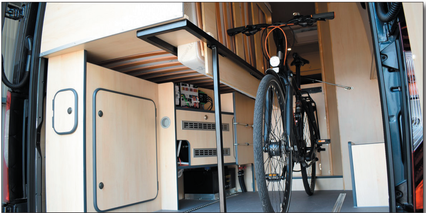
Heckstauraum mit hochgeklapptem Bett

kleinen Ecke des Bettes jedoch leicht zu verschmerzen. Das rechte Bett ist darüber hinaus hochstellbar, um den Transport von z.B. Fahrrädern oder anderem sperrigen Gepäck zu erleichtern.