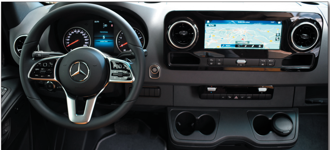
Der neue Sprinter mit dem MBUX-System

Die neuen Sitze mit vielfältig verstellbarer Lordosenstütze finden ebenfalls großen Anklang.