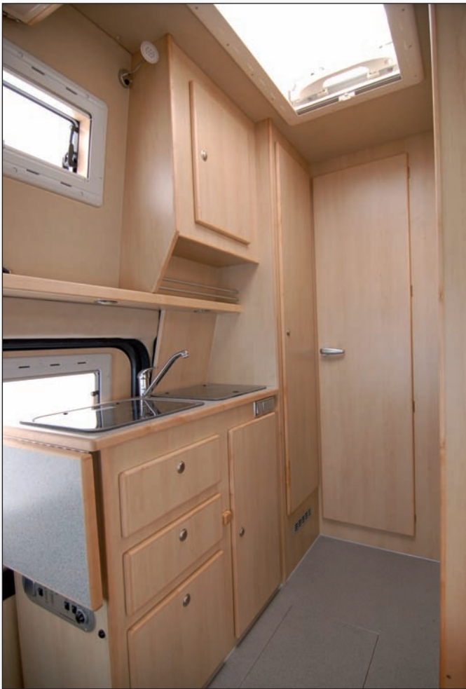
Küchenzeile / Kleiderschrank

Weitere Stauräume finden sich unterhalb der Sitzgruppe, sehr gut zugänglich durch einen großzügigen Auszug, sowie in diversen Ablagen und einem Dachstaukasten oberhalb des Küchenblocks. Pfiffige Details, wie der Flaschenkasten an der Tischhalterung, runden dieses einzigartige Fahrzeug ab.