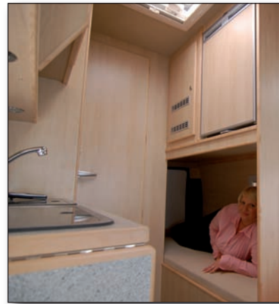
Cargoraum mit Bett, darüber Kühlschrank