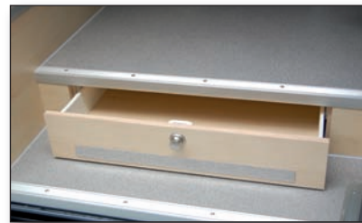
Schublade im Podest

einer Bordbatterie mit 235 Ah Kapazität, ein Ladegerät mit 30 A Ladeleistung und einer konsequent auf LED ausgelegten Beleuchtung, seien hier erwähnt.