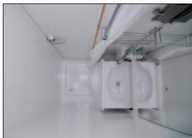
Nasszelle mit Waschtisch

Eine große Hebe-Schiebeluke (90 x 50 cm) gehört deshalb zum Serienstandard. Die Dachhaube und alle Fenster sind selbstverständlich isolierverglast, aufstellbar und mit integrierten Kombirollos versehen. Optional besteht die Möglichkeit, eine weitere große Hebe-Schiebeluke zu montieren. Der Möbelbau besteht aus 15 mm Pappelsperholz mit hochwertiger HPL-Beschichtung, generell mit Massivholzleisten verarbeitet. Der Möbelbau ist in verschiedenen Dekoren, optional auch in Echtholz furnier, erhältlich. Als Wunschkomponenten stehen für die Gestaltung u.a. Parkettfußboden, eine Fußbodenheizung oder