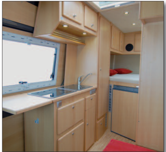
Küche und Kleiderschrank