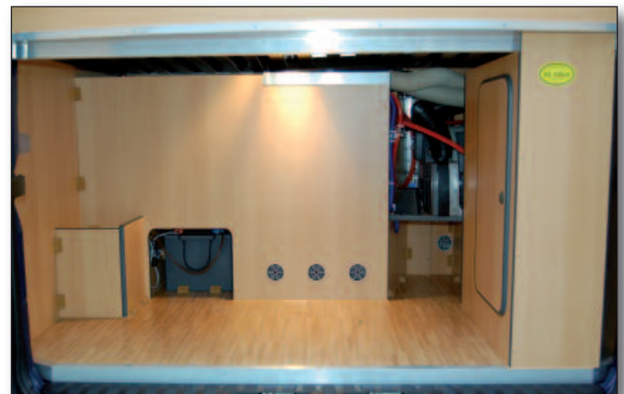
Stauraum unter Heckbett

eine automatische, digitale Satellitenanlage zur Verfügung. Der Frischwassertank faßt 100 l, der Abwassertank hat eine Kapazität von 60 l und ist unterflur untergebracht (ein weiterer Abwassertank kann zusätzlich frostsicher im Heckstauraum montiert werden). Die Elektroanlage basiert auf einer 235 Ah großen Gelbatterie mit einem entsprechenden Ladegerät mit 30 A Ladeleistung, div. LED-Leuchten und Steckdosen. Durch die relativ große Anzahl von Holz- und Stoffdekoren lässt sich der individuelle Geschmack eines jeden Kunden wunderbar auf das Fahrzeug übertragen.