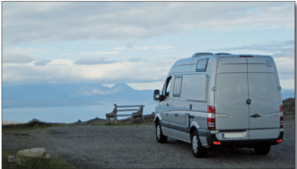
Rondo unterwegs. . .