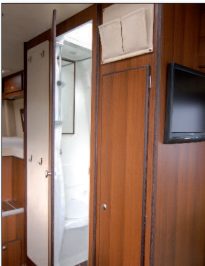
Nasszelle und Kleiderschrank

ausstattungen ist lang und reicht von Allradantrieb bis Xenon-Licht. Wir liefern den Luxor in einer speziellen Fahrwerksvariante mit verstärkten Stabilisatoren und verstärkten Stoßdämpfern, die für noch mehr Fahrsicherheit sorgt. Das zulässige Gesamtgewicht beträgt 3.500 kg. Dadurch unterliegt das Fahrzeug denselben gesetzlichen Bestimmungen wie ein Pkw.