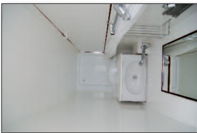
Nasszelle mit Waschtisch

Abdeckung sowie eine klappbare Arbeitsplattenverbreiterung. Oberhalb des Küchenblocks gibt es noch einen Dachstaukasten mit integriertem Gewürzregal. Auf der linken Fahrzeugseite vor dem Bett hat die Nasszelle mit Duschwanne, Cassetten-Toilette und ausziehbarem Waschtisch ihren Platz. Von der Nasszelle aus zugänglich sind Stauschränke und es gibt weitere Ablagen. Im Anschluß an die Nasszelle nach vorne hat der Kleiderschrank seinen Platz. Die davor angeordnete Sitzgruppe besteht – abhängig vom Kundenwunsch – aus einem Einzelsitz oder einer Sitzbank für zwei Personen,