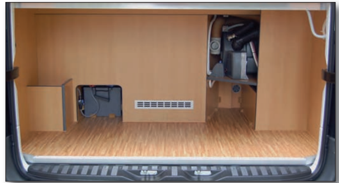
Stauraum unter Heckbett

Geräumige Dachstaukästen befinden sich oberhalb der Fahrerhauskabine, oberhalb der Dinette und umlaufend am Heckbett.