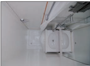
Nasszelle mit Waschtisch

Im Anschluss an das Heckbett auf der rechten Fahrzeugseite befindet sich der großzügige Kleiderschrank mit Hängemöglichkeiten und Ablagefächern, darunter die herausziehbare Trittstufe, um leichter in das bequeme Doppelbett zu gelangen.