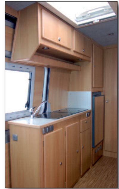
Küchenzeile mit Kühlschrank

Herzstück der Elektroanlage ist eine 235 Ah starke Gelbatterie. Diese wird von einem 30 A Ladegerät versorgt. Die Beleuchtung besteht ausschließlich aus Warmlicht-LED-Leuchten, die so zahlreich sind, dass eine hervorragende Ausleuchtung des Fahrzeugs gewährleistet wird. Selbstverständlich sind 12- und 220-V-Steckdosen an Bord. Die Gasversorgung erfolgt über zwei Flaschen mit 5 und 11 kg Inhalt, die bequem im Heck des Fahrzeugs zugänglich sind. Der Möbelbau besteht