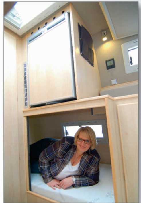
Einzelbett im Cargoraum

Der Kleiderschrank befindet sich zwischen dem Cargoraum und der Sitzgruppe.