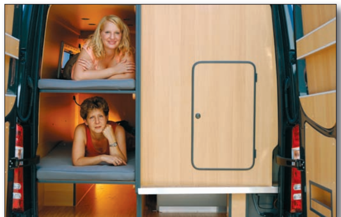
Cargoraum mit optionalen Stockbetten