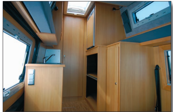
Kleiderschrank, Kühlschrank hochgestellt und Cargoraum

tung des Fahrzeuges gewährleistet wird. Selbstverständlich sind 12- und 220-Volt-Steckdosen an Bord. Die Gasversorgung erfolgt über zwei Flaschen mit 11 kg Inhalt, die bequem im Heck des Fahrzeuges zugänglich sind. Alternativ ist eine Ausstattung mit einer dieselbetriebenen Heizung, bzw. einem dieselbetriebenen Ceran-Kochfeld möglich. Der Möbelbau besteht grundsätzlich aus 15 mm Pappelsperholz mit HPL-Schichtstoff, lieferbar in diversen Dekoren. Alle Kanten sind generell in Echtholz ausgeführt. Natürlich besteht auch die Möglichkeit, das Fahrzeug mit einem kompletten Echtholzausbau zu bekommen. Die Isolierung aus 20 mm PE-Schaum erfüllt höchste Ansprüche. Darüber hinaus gehören Isotherm-