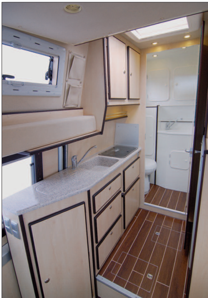
Küchenzeile, Blick in die Naßzelle

einen ein Höhenangleich mit den drehbaren Fahrerhausitzen erreicht, zum anderen wird in diesem Doppelboden Warmluft transportiert. Das Fahrzeug hat also serienmäßig eine Fußbodenheizung. Die Staumöglichkeiten in unserem Modell Corona sind vielfältig. Der Kleiderschrank ist großzügig bemessen, darüber hinaus gibt es Fächer für die Wäsche sowie ein geräumiges Küchenteil, komplett mit Auszügen gestaltet. Kocher und Spüle werden versenkt eingebaut und verfügen über eine integrierte Glasabdeckung und elektronische Zündung. Auf Wunsch ist sogar ein Backofen in der Küche erhältlich. Halbhoch in die Stauschränke integriert ist ein 110 l Kompressor-Kühlschrank mit großem Gefrierfach. Oberhalb des Kühlschranks ist ein weiteres Fach vorgesehen, in dem optional ein TFT Monitor eingebaut werden kann. Der gesamte Möbelbau ist in Pappelsperholz mit HPL Schichtstoff ausge-