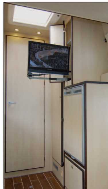
Kleiderschrank, Kühlschrank 110 l, TFT Monitor

Die Bordtechnik mit 110 l Kühlschrank, Kombi-Heizung Combi 4 mit Warmwasserbereitung der Firma Truma (optional auch mit Dieselbetrieb erhältlich), GEL-Bordbatterie mit einer Kapazität von 235 Ah, 30 A Ladegerät mit IUoU Kennlinie, 150 l Frischwassertank, großem Hebeschiebedach, großzügig