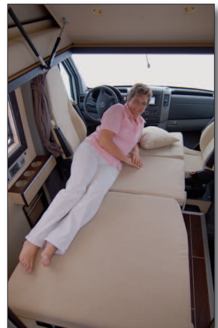
Zum Bett umgebaute Sitzgruppe

bank lässt sich ebenfalls mit wenigen Handgriffen in ein Doppelbett verwandeln. Die Sitzgruppe bestehend aus den komfortablen und bequemen Fahrerhaussitzen sowie der Sitzbank und ist auch bei heruntergeklapptem Dachbett gut zugänglich. Dass die Sitzmöbel vielfältig verstellbar sind ist ebenso selbstverständlich wie die Wahl der extrem hochwertigen Bezugstoffe. Die gesamte Sitzgruppe ruht auf einem ca. 5 cm starken Doppelboden. Mit diesem Doppelboden wird zum