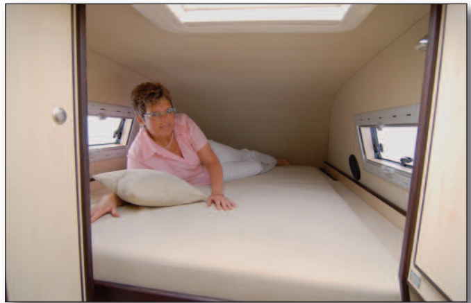
Großzügiges Hubbett im Dach

Unser Modell Corona basiert auf dem Mercedes-Benz Sprinter mit dem Radstand 3.665 mm. Daraus ergibt sich eine Außenlänge des Fahrzeuges von 5,91 m und eine Breite von 1,99 m. Die CDI-Motoren beginnen mit einer Leistung von 80 kW/109 PS im 4-Zylinderbereich. Optional gibt es als weitere Leistungsklassen noch 95 kW/129 PS bzw. 120 kW/163 PS. Als Spitzenmotorisierung ist ein 3-Liter V6 CDI-Motor mit 140 kW/190 PS ebenfalls im Angebot. Alle Motoren sind mit Partikelfiltern ausgestattet und entsprechen EURO 5. Serienmäßig sind die Fahrzeuge mit einem 6-Gang-Schaltgetriebe ausgestattet. Optional ist eine 5-Gang-Wandlerautomatik für alle Motorisierungsvarianten erhältlich. Wesentliche Sicherheitsausstattung – unter anderem ESP der neuesten Generation – aber auch ABS, ASR und Fahrer-Airbag sind genauso Serienstandard wie Zentralverriegelung mit Funk, elektrische Fensterheber, elektrisch einstell- und beheizbare Außenspiegel sowie Wärmedämmglas im Fahrerhaus. Die Liste der weiteren