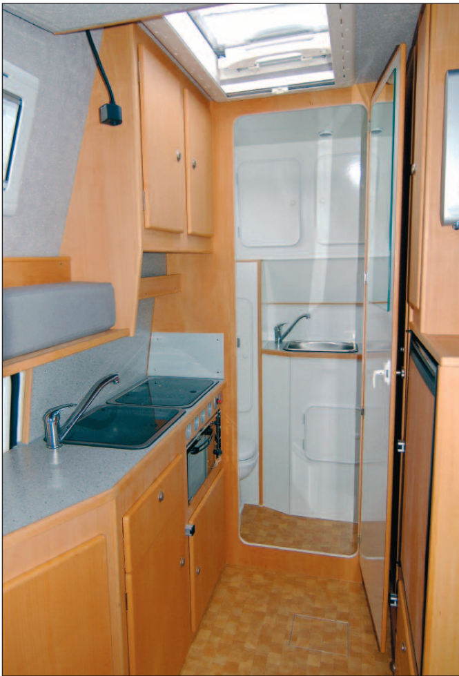
Küchenzeile mit Backofen, Blick in die Naßzelle

Höhenangleich mit den drehbaren Fahrerhaussitzen erreicht, zum anderen wird in diesem Doppelboden Warmluft transportiert, so dass man von einer Art Fußbodenheizung sprechen kann, mit Luft-Austrittsöffnungen in den besonders kritischen Bereichen der Schiebetür und der Fahrerhaustüren. Auf Wunsch wird der Doppelboden mit Echtholz-Parkett ausgestattet. Die Staumöglichkeiten in unserem Modell Corona sind vielfältig. Der Kleiderschrank ist großzügig bemessen, darüber hinaus gibt es Fächer für die Wäsche sowie geräumige Küchenschränke mit mehreren Vollauszügen. Kocher und Spüle werden versenkt eingebaut und verfügen über eine integrierte Glasabdeckung und Piezo-Zündung. Auf Wunsch ist sogar ein Backofen in der Küche erhältlich. Halbhoch in die