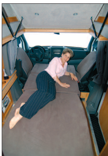
Zum Bett umgebaute Sitzgruppe

teren Sonderausstattungen ist lang und reicht von Allradantrieb bis Xenon-Licht. Wir liefern den Corona in einer speziellen Fahrwerksvariante mit verstärkten Stabilisatoren und verstärkten Stoßdämpfern, die für noch mehr Fahrsicherheit sorgt. Das zulässige Gesamtgewicht beträgt 3.500 kg. Dadurch unterliegt das Fahrzeug denselben gesetzlichen Bestimmungen wie ein PKW.