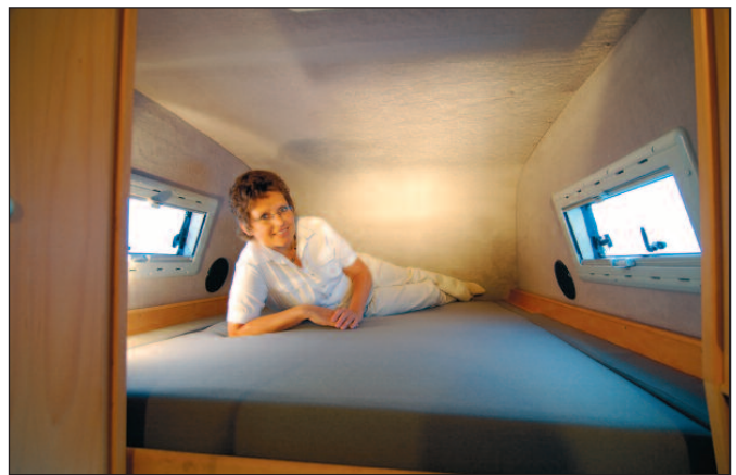
Großzügiges Hubbett im Dach

Unser Modell Corona basiert auf dem Mercedes-Benz Sprinter mit dem Radstand 3.665 mm. Daraus ergibt sich eine Außenlänge des Fahrzeugs von 5,91m und eine Breite von 1,99 m. Die CDI-Motoren beginnen mit einer Leistung von 80 kW/109 PS im 4-Zylinderbereich. Optional gibt es als weitere Leistungsklassen noch 95 kW/129 PS bzw. 110 kW/150 PS. Als Spitzenmotorisierung ist ein 3-Liter V6 CDI-Motor mit 135 kW/184 PS ebenfalls im Angebot. Alle Motoren sind mit Partikelfiltern ausgestattet und entsprechen EURO 4. Serienmäßig sind die Fahrzeuge mit einem 6-Gang-Schaltgetriebe ausgestattet. Optional ist eine 5-Gang-Wandlerautomatik für alle Motorisierungsvarianten erhältlich. Wesentliche Sicherheitsausstattung – unter anderem ESP der neuesten Generation – aber auch ABS, ASR und Fahrer-Airbag sind genauso Serienstandard wie Zentralverriegelung mit Funk, elektrische Fensterheber, elektrisch einstellbare und beheizbare Außenspiegel sowie Wärmedämmglas im Fahrerhaus. Die Liste der wei-