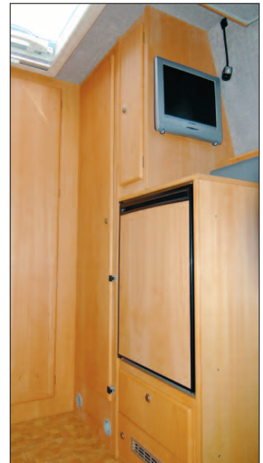
Kleiderschrank, Kühlschrank 110 l, TFT Monitor

Die Bordtechnik mit 110 l Kühlschrank, Kombi-Heizung Combi 4 mit 12,5 l Warmwasser der Firma Truma, GEL-Bordbatterie mit einer Kapazität von 235 Ah, 30 A Ladegerät mit IUoU Kennlinie, 150 l Frischwassertank, großem Hebeschiebedach, groß-