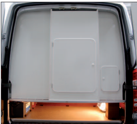
Heckstauraum mit Gasflaschenfach

Höhenangleich mit den drehbaren Fahrerhaussitzen erreicht, zum anderen wird in diesem Doppelboden Warmluft transportiert, so dass man von einer Art Fußbodenheizung sprechen kann, mit Luft-Austrittsöffnungen in den besonders kritischen Bereichen der Schiebetür und der Fahrerhaustüren. Auf Wunsch wird der Doppelboden mit Echtholz-Parkett ausgestattet. Die Staumöglichkeiten in unserem Modell Corona sind vielfältig. Der Kleiderschrank ist großzügig bemessen, darüber hinaus gibt es Fächer für die Wäsche sowie geräumige Küchenschränke mit mehreren Vollauszügen. Kocher und Spüle werden versenkt eingebaut und verfügen über eine integrierte Glasabdeckung und Piezo-Zündung. Auf Wunsch ist sogar ein Backofen in der Küche erhältlich. Halbhoch in die