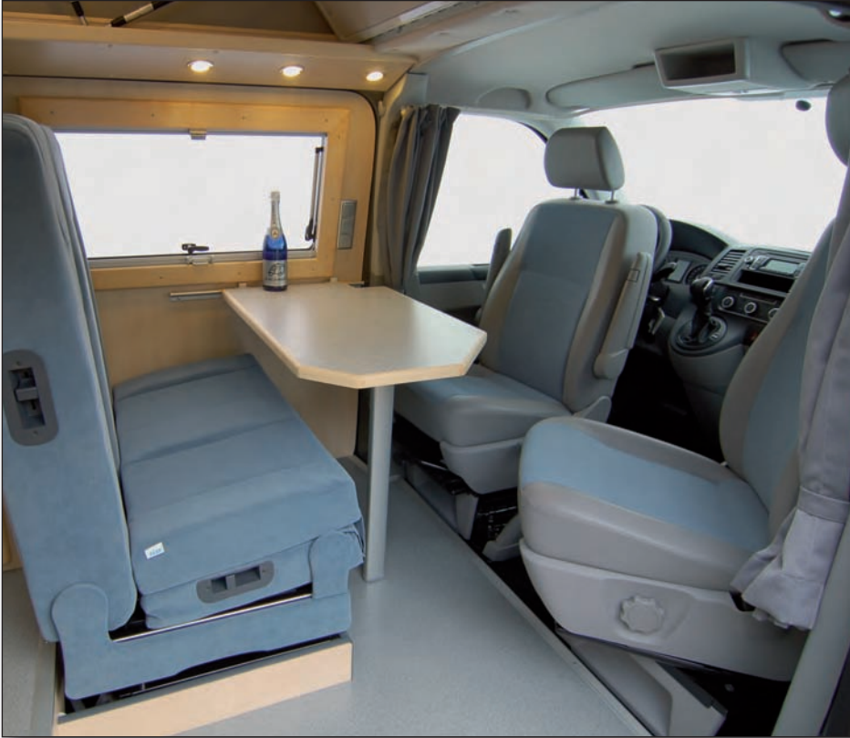
Sitzgruppe mit optionaler Vario-Sitzbank

Der T5 ist das ideale Basisfahrzeug für die Kunden, die ein anspruchsvolles, komfortables und sicheres Fahrwerk zu schätzen wissen. Das Fahrzeug fährt sich ähnlich leise und wendig und dabei sicher wie ein PKW. Die möglichen Motorisierungsvarianten sind moderne Dieselmotoren mit 75 bis 132 kW, gepaart mit dem 5- bzw. 6-Gang Schaltgetriebe. Optional ist für die stärkeren Motoren auch ein 7-Gang DSG-Getriebe (automatisch) erhältlich, das ebenfalls zu den ausgezeichneten Fahreigenschaften beiträgt. Die Sicherheitsausstattung umfasst selbstverständlich ABS, ESP, Fahrer- und Beifahrerairbag sowie – im ESP integriert – einen Anfahrassistenten. Auch sind viele komfortorientierte Ausstattungen erhältlich. Ebenfalls lieferbar ist ein permanenter Allradantrieb, „4Motion“ genannt. Die Basis unseres Modells Apollo ist der Kastenwagen mit dem langen Radstand, immer in der Version mit einem zulässigen Gesamtgewicht von 3.100 kg. Wahlweise lassen sich bestimmte Versionen mit einem zulässigen Gesamtgewicht von 3.200 kg ordern. Die Fahrzeuglänge beträgt 5,29 m, die Fahrzeugbreite 1,90 m, die Höhe ohne Dachluke beträgt 2,70 m.