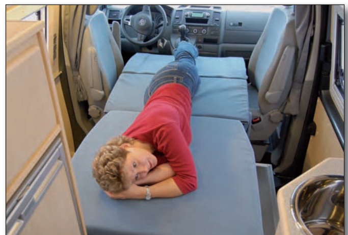
Bett unten (optional)