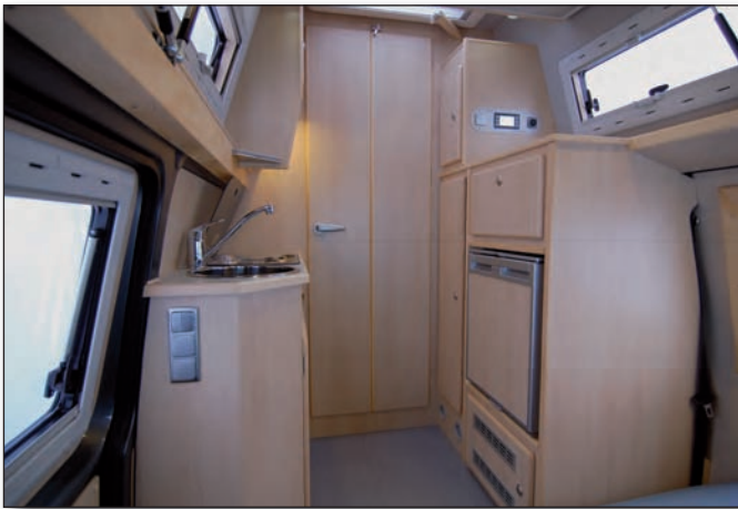
Küche und Kleiderschrank

schrank seinen Platz. Darin ist die Truma Heizung-Boiler-Kombination Combi 4 und der Kompressorkühlschrank der Marke WAECO mit 65 l Inhalt untergebracht. Im vorderen Teil des Fahrzeugs steht hinter den drehbaren VW Komfortsitzen eine Doppelsitzbank, die sich optional in ein weiteres Bett verwandeln lässt. Die Tischanlage zwischen der Sitzgruppe ist verschiebbar, genau so wie die Sitzbank selbst. Die Sitzfläche und die Rückenlehne lassen sich fein einstellen, so dass ein optimaler Sitzkomfort gewährleistet ist. Das Hubbett ist im Dachbereich oberhalb der Windschutzscheibe angeschlagen und besteht aus einem zweiteiligen Stahlrahmen, der von einem Lattenrost ausgefüllt wird. Auf dieser Unterkonstruktion liegt eine durchgehende Matratze, die 2 m lang und 1,35 m breit ist. Der gesamte Möbelbau besteht aus hochwertigem Pappelsperholz mit HPL-Schichtstoff und wird grundsätzlich mit Massivholzleisten verarbeitet. Optional ist gegen Mehrpreis ein Ausbau in Echtholz furnier erhältlich. Die im Fahrzeug verbauten Fenster sind selbstverständlich isolierverglast, aufstellbar und mit integrierten Kombirollen versehen. Ein Rundumvorhang und Isothermmatten fürs Fahrerhaus sind ebenfalls serienmäßig. Genau wie bei unseren anderen Modellen ist beim Apollo ein großes Maß von individuellen Wünschen im Hinblick auf die konkrete Ausstattung und auch das Design möglich. Die bei größeren Fahrzeugen möglichen Komponenten wie Solaranlage, automatische Satelliten-Anlage und TFT-Monitor