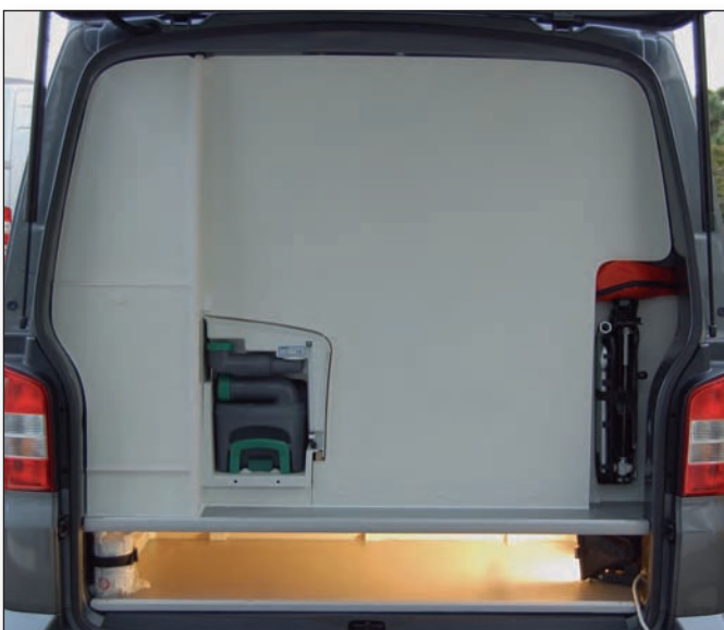
Heckansicht mit Aussenstauraum